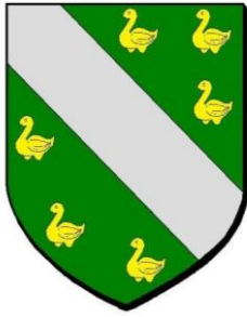
Ville de BOLLWILLER