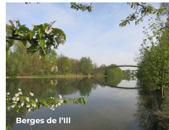
Berges de l'ill

Cette promenade longe les deux côtés des berges de l'ill, principale rivière d'Alsace (208 km), qui prend sa source près de Winkel (Jura alsacien) et se jette dans le Rhin au Nord de Strasbourg après avoir traversé le Sundgau, Mulhouse, Colmar et Sélestat.