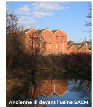
Ancienne Ill devant l'usine SACM