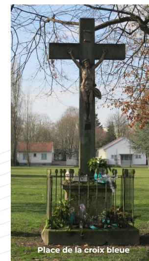
Place de la croix bleue